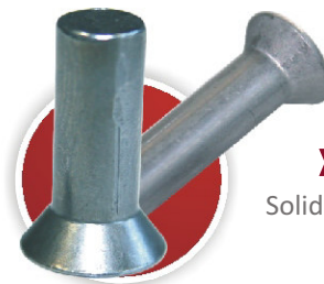
» Vollniet DIN 661 (Senkkopf) Solid Rivet DIN 661 (Countersunk Head) Rivet plein DIN 661 (tête fraisée)