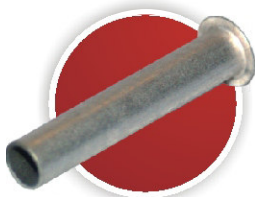
» Rohrniet DIN 7340 Tubular Rivet DIN 7340 Rivet tubulaire DIN 7340