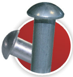
» Vollniet DIN 660 (Halbrundkopf) Solid Rivet DIN 660 (Round Head) Rivet plein DIN 660 (tête semi-ronde)

La pose s'effectue toujours des deux côtés de la pièce support