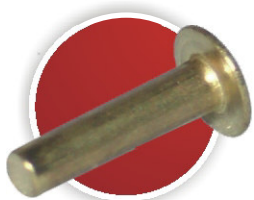
» Flachrundvollniete DIN 674 Truss Head Rivet DIN 674 Rivet plein DIN 674 (tête plate)