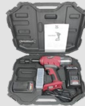
Robuster Kunststoffkoffer mit Metallverschlüssen und Platz für zwei Akkus