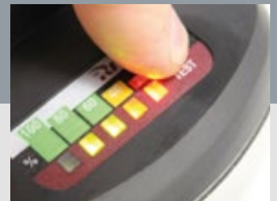
Optische Ladestandsanzeige auf jedem Rivdom-Akku