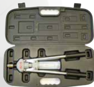
Hebelnietgerät BZ 70 im schlagfesten Kunststoff-Koffer.