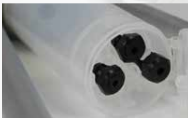
Wechselmundstücke in verschlossenem Fach am Stiftaufangbehälter.