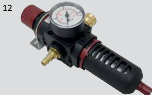
Filterregler G3/8 mit Filterdruckregler, Manometer, Kunststoffschutzkorb, Befestigungswinkel, Stecknippel G3/8 und Schnellschlusskupplung

Für den reibungslosen Betrieb unserer Druckluftwerkzeuge beachten Sie unbedingt die Angaben in den Bedienungsanleitungen! Wichtig sind zum Erhalt von Leistung und Vermeidung von Defekten die Eigenschaften der verwendeten Druckluft . Kondenswasser gefährdet die Schmierung und verursacht Korrosion im Werkzeug! Die Motoren müssen kontinuierlich geschmiert werden! Wir empfehlen unbedingt die Verwendung von Wartungseinheiten für saubere und geölte Luft (VNG) oder Filterdruckminderern für saubere und tockene Luft (BZ)!