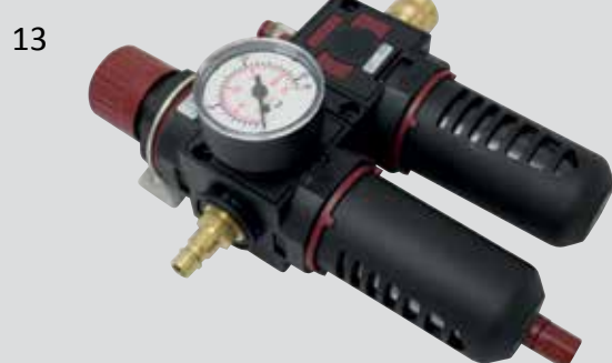
Wartungseinheit 2teilig G3/8 mit Kunststoffschutzkorb, Befestigungswinkel, Stecknippel G3/8, Schnellschlusskupplung und 1L Luftmotorenoel