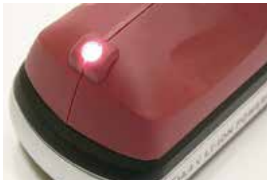
Point de fixation éclairé par une LED