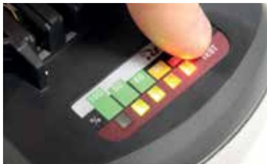
Affichage optique de l'état de charge sur chaque batterie

Les rivets aveugles jusqu'à 5 mm de diamètre toutes matières peuvent être posés en toute sécurité grâce à un moteur puissant et une adaptation optimale. Les batteries Li-Ion modernes ont une grande capacité et sont de nouveau vite prêts à fonctionner avec le chargeur fourni. Des détails pratiques comme par exemple le récupérateur transparent qui permet de pouvoir toujours contrôler le niveau de remplissage des tiges cassées et l'éclairage à LED du point de fixation complètent la présentation satisfaisante d'un outil qui a déjà convaincu beaucoup de clients avec son excellent rapport qualité prix. Maintenant également avec différentes variantes d'équipement.