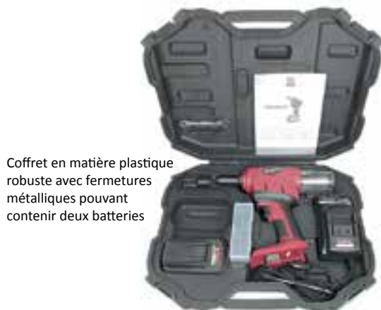
Coffret en matière plastique robuste avec fermetures métalliques pouvant contenir deux batteries