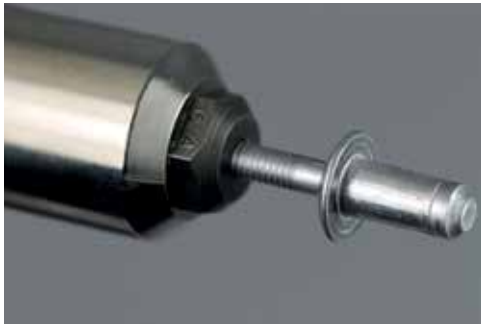
Für FERÖ®-BULB Blindniete ausgelegt

Unser Außendienst stellt Ihnen generell alle pneumatisch-hydraulischen Werkzeuge vor Ort vor. Vereinbaren Sie einen Termin!