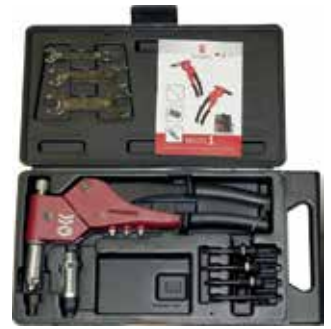
MULTI 1 en coffret plastique résistant aux chocs.