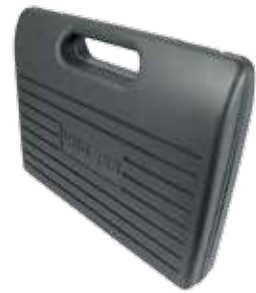
VNG 255 im schlagfesten Kunststoff-Koffer.