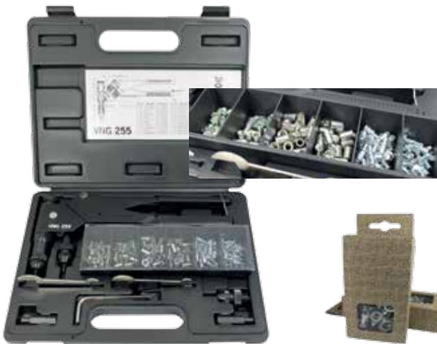
Inkl. Sortiment Blindnietmuttern und Blindnietgewindebolzen. 100er Nachfüllpackungen siehe unten.